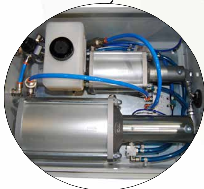
UNIDADE DE CONTROLO